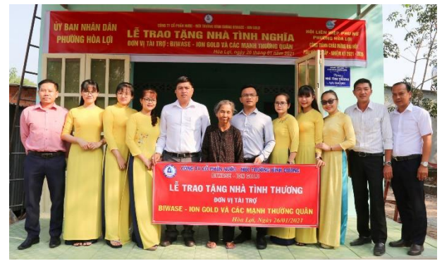
Đoàn viên thanh niên Chi nhánh Dịch vụ Đô thị Biwase trao nhà tình thương cho gia đình khó khăn tại phường Hòa Lợi, Thị xã Bến Cát

Quần thể đền tưởng niệm các Vua Hùng được Hoa viên Bình Dương đầu tư xây dựng phỏng theo nguyên bản Đền Hùng - Phú Thọ với biểu tượng Cây Đa cổ thụ tỏa bóng mát và ôm trong lòng những