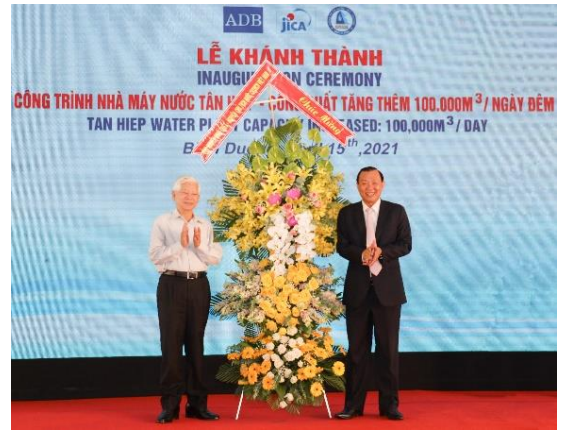
Ông Nguyễn Minh Triết - Nguyên Chủ tịch nước CHXHCN Việt Nam đến dự và gửi hoa chúc mừng Lễ khánh thành

Các chuyên gia cấp nước nhận xét: Đây là công trình Nhà máy cấp nước lớn nhất và đầu tiên tại Việt Nam, sử dụng vốn ODA không qua bảo lãnh của chính phủ.