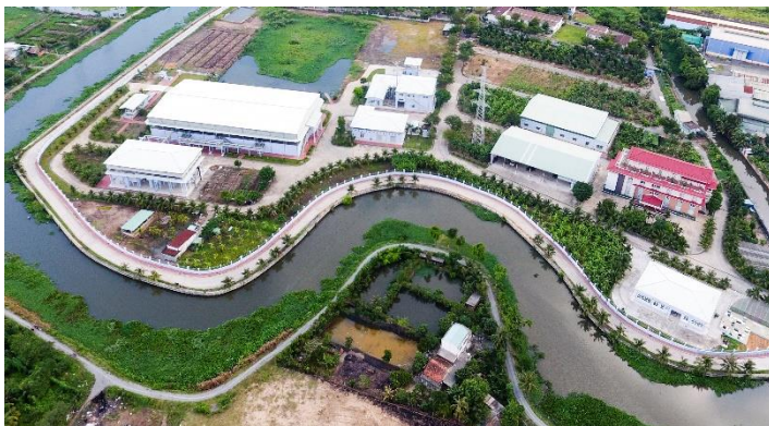
Rạch Lái Thiêu được hồi sinh từ khi Nhà máy thu gom xử lý nước thải sinh hoạt Thuận An đi vào hoạt động

Ngoài ra chi nhánh Dịch vụ Đô thị Biwase còn là nhà cung cấp vật tư, văn phòng phẩm, quần áo bảo hộ lao động uy tín. Với tinh thần xung kích, kết nối cộng đồng, nhiều năm qua Cán bộ - Nhân viên Chi nhánh Dịch vụ Đô thị Biwase đã có mặt kịp thời cùng các đại lý, bạn hàng, nhà tài trợ, mạnh thường quân mang tiền, quà, lương thực, thực phẩm đến những nơi khó khăn, thiên tai, bão lũ, chia sẻ, hỗ trợ chính quyền và người dân vượt qua khó khăn, khôi phục lại đời sống, sản xuất.